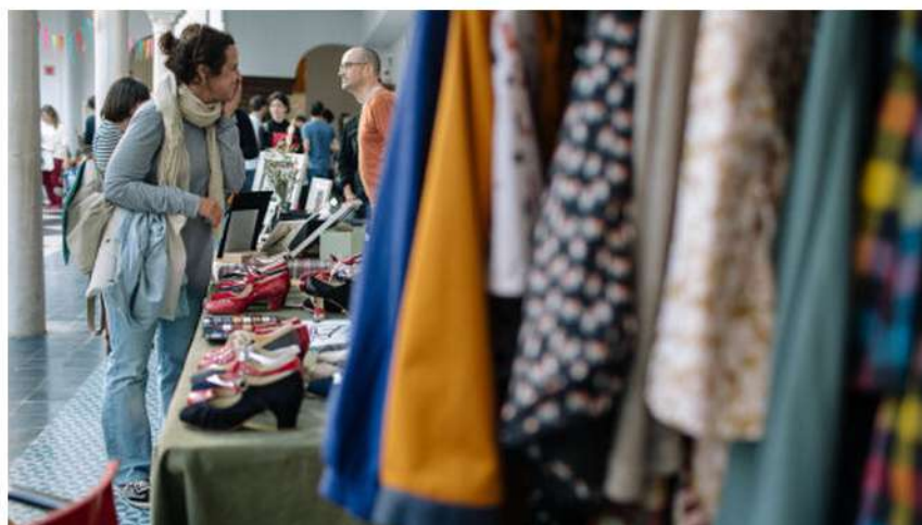
Sevilla Swing Market, complementos y ropa 'vintage', en una edición pasada.

Siguiendo con el programa formativo y más allá del baile, Sevilla Swing vuelve a incluir una interesante oferta de masterclasses sobre distintos aspectos musicales de este género, impartidas por los propios miembros de los grupos invitados. Así, los integrantes de The Meeting (Collectif Paris Swing) enseñarán el lenguaje y los códigos del hot jazz y el swing de Nueva Orleans, mientras que Samson Schmitt profundizará en los aspectos que definen el sonido característico del jazz manouche , tanto desde la perspectiva de la guitarra solista como de acompañamiento.