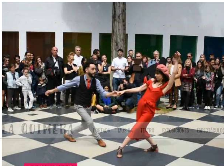
CONCIERTOS EN SEVILLA