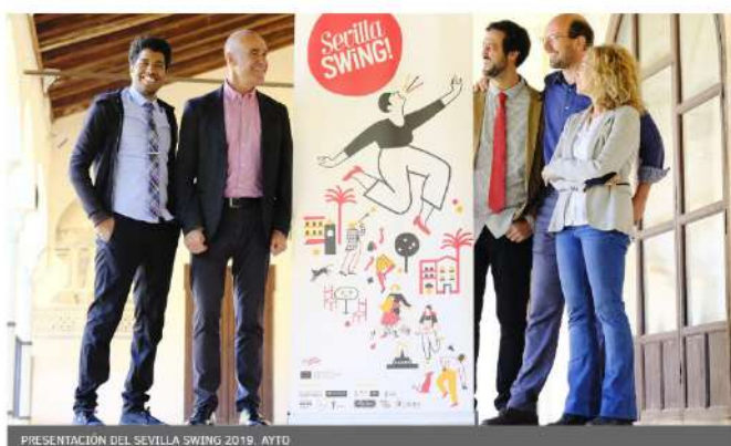
PRESENTACIÓN DEL SEVILLA SWING 2019.

Sevilla celebrará del 4 al 7 de abril la séptima edición de su festival de Swing, que aspira a superar las 5.000 personas en los conciertos