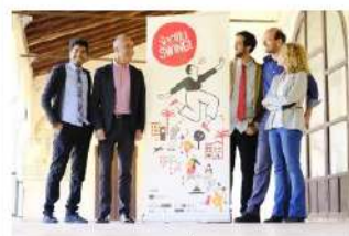
El festival se celebrará del 4 al 7 de abril.

Con este póker de artistas como reclamo principal se presenta la séptima edición del Sevilla Swing, que se celebrará en la capital hispalense del 4 al 7 de abril. Un evento anual que se ha convertido en referencia indispensable dentro del panorama europeo de música y baile swing, el cual ha experimentado un gran auge en los últimos años.