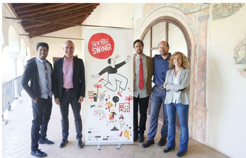
Presentación del VII Sevilla Swing Festival.