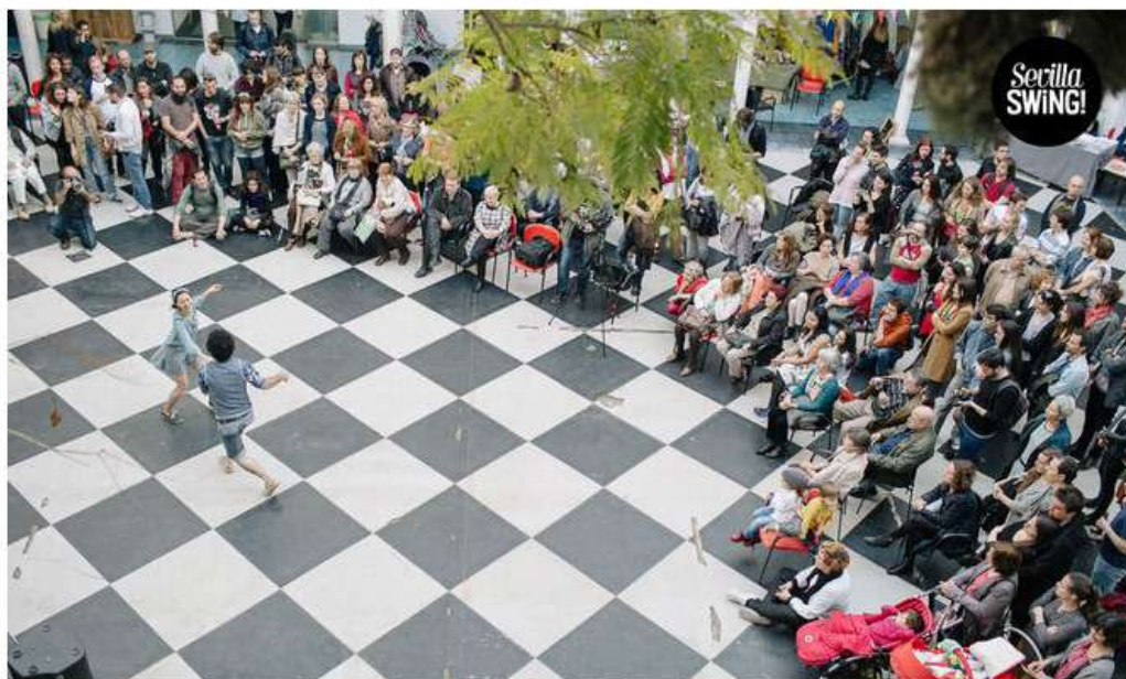
Una imagen de una edición anterior de Sevilla Swing.

Desde este jueves hasta este domingo se desarrollan las actividades de la séptima edición del Festival Sevilla Swing! en distintos espacios de la ciudad y en el Parque de la Cultura de Gines. Habrá dos conciertos en el Teatro Alameda , que están protagonizados por Samson Schmitt y The Meeting (este viernes) y Kind Of Dukish y Albanie Falletta & The International All Stars (este sábado). También se celebrarán actividades en El Coco Verde (el mercadillo vintage Sevilla Swing Market, conciertos y más) y por las noches las Sevilla Swing Party en la Sala Holiday.