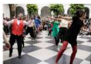
Sección del Cabaret Swing celebrando la pasada edición en el Cicus.

Ya el viernes 5, la Plaza José Luis Vila acogerá un concierto de la Sursonora Big Band , formación nacida en los talleres de músicas creativas e improvisación del Cicus y dirigida por el músico multinstrumentista especializado en jazz Nacho Botonero , que interpreta un repertorio en la tradición de las genuinas big bands lideradas por figuras como Court Basie o Duke Ellington . Por la