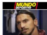
Durísimo recado de Zlatan Ibrahimovic a Carlos Vela