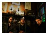
El trio de Samson Schmitt, uno de los mejores guitarristas de la tradición 'manouche' actual.

La noche del viernes 5 en el Teatro Alameda estará protagonizada por el quinteto The Meeting , proyecto paralelo de una de las nuevas bandas europeas de referencia en este estilo, Collectif Paris Swing . Fundado en 2017 por un grupo de jóvenes virtuosos, en apenas un par de años han hecho vibrar las paredes de los principales clubes europeos con un jazz explosivo que remite a los locos años 20, en los que bailes como el charleston o el black bottom hacían olvidar la Gran Depresión y una Ley Seca que llegaba a su fin. The Meeting añade además la presencia del reputado clarinetista italiano Giacomo Smith , toda una figura mundial del jazz con su banda Kansas Smitty's y acompañando a músicos míticos como Wynton Marsalis .