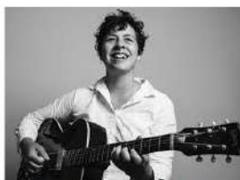
La cantante norteamericana Albanie Falletta, actuará por primera vez en España.

Redacción. La guitarrista y cantante norteamericana Albanie Falletta , una de las intérpretes mejor consideradas de la escena musical de Nueva Orleans (Estados Unidos) en la recuperación del jazz y el blues tradicional, actuará por primera vez en España el próximo 6 de abril en el Teatro Alameda, como parte del programa del VII Sevilla Swing Festival.